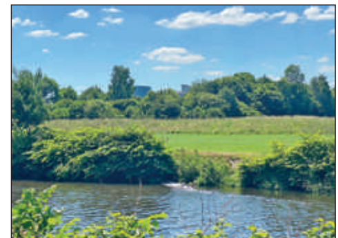
... das dann in die Zwickauer Mulde und damit in die Natur geleitet wird