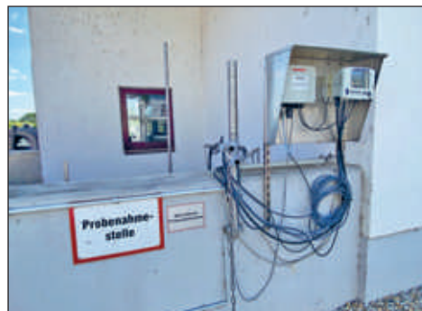
Probenentnahmestelle für die finale Kontrolle des Wassers...