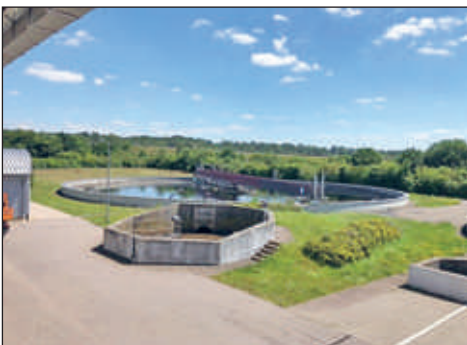
Das Nachklärbecken