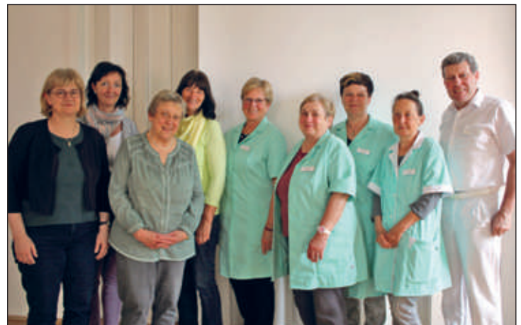
Treffen der Grünen Damen und der Krankenhausleitung Ende Mai im Haus Stollberg